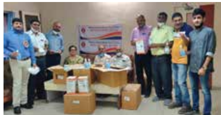
कोरोना बचाव किट वितरण

गुजरात संभाग स्थित महावीर इन्टरनेशनल सूरत केन्द्र द्वारा नवम्बर माह में भामाशाह सोनी परिवार के तत्वावधान में न्यू सिविल