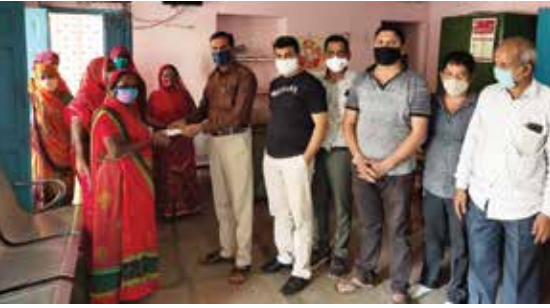
मास्क वितरण सेवाकार्य

उदयपुर संभाग स्थित महावीर इंटरनेशनल ऋषभदेव केन्द्र द्वारा नवम्बर माह में एन-95 मास्क वितरण सेवाकार्य विभिन्न स्थानों