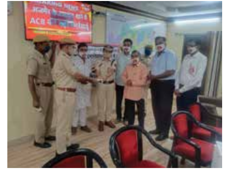
मास्क वितरण सेवाकार्य

जोधपुर संभाग स्थित महावीर इंटरनेशनल नागौर केन्द्र द्वारा अक्टूबर माह में पौधारोपण कार्यक्रम राजकीय उच्च प्राथमिक विद्यालय में