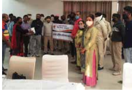
Mask distribution program

Vira : Vira Member's distributed 100 Masks in Munciple corporation Panchkula to their workers in community Center 12A Panchkula.