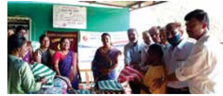
जरूरतमंदों में कंबल वितरण

औरंगाबाद-अहमदनगर संभाग स्थित महावीर इन्टरनेशनल अहमदनगर केन्द्र, महावीर इन्टरनेशनल अहमदनगर वीरा केन्द्र के