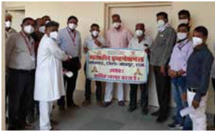
मास्क वितरण सेवाकार्य

जोधपुर संभाग स्थित महावीर इंटरनेशनल लोहावट केन्द्र द्वारा अक्टूबर माह में एन-95 मास्क वितरण कार्यक्रम उपखण्ड एवं तहसील