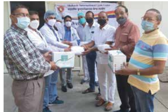
मास्क वितरण सेवाकार्य

इन्दौर-उज्जैन संभाग स्थित महावीर इन्टरनेशनल उज्जैन केन्द्र एवं महावीर इन्टरनेशनल उज्जैन वीरा केन्द्र द्वारा