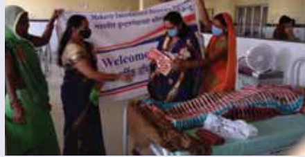
बेबी किट वितरण

ही प्रसूताओं को राशि एवं साड़ियां भेंट की। मासिक संगोष्ठी का आयोजन किया जिसमें कन्याओं की रक्षा एवं सम्मान का संकल्प लिया। जीवदया सेवाकार्य: गौशाला में गोसेवा की एवं पशुआहार खिलाया।