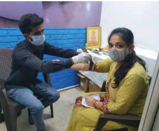
विशाल निःशुल्क स्वास्थ्य जाँच, परामर्श शिविर

भीलवाड़ा संभाग स्थित महावीर इन्टरनेशनल डायमंड वीरा भीलवाड़ा केन्द्र के तत्वावधान में विशाल निःशुल्क स्वास्थ्य जाँच, परामर्श शिविर आयोजित किया गया। शिविर में ब्लड सेंपल के माध्यम से निःशुल्क जाँचें की जा रही हैं। एवं लाभार्थियों के सुरक्षा को ध्यान में रखकर ब्लड सेंपल सुविधा घर से भी ली जा रही है। इस शिविर में 200 व्यक्तियों के ब्लड सेंपल द्वारा जाँचें की गई हैं।