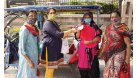
मास्क वितरण सेवाकार्य

अजमेर संभाग स्थित महावीर इंटरनेशनल सुनंदा वीरा केन्द्र द्वारा अक्टूबर माह में गर्भावस्था-शैशवावस्था परियोजना के तहत यशोदा कार्यक्रम तेजा चौक आँगनवाड़ी में आयोजित किया गया। कार्यक्रम में 10 गर्भवती महिलाओं को पोषाहार किट (दूध, बिस्किट) भेंट किए। एन-95 मास्क वितरण: तेजा चौक आँगनवाड़ी एवं मित्तल हॉस्पिटल में