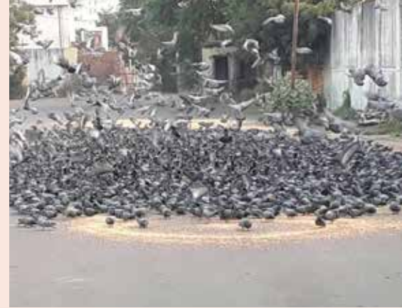
पक्षिशाला में कबूतरों को मकाई डालते हुए सदस्य