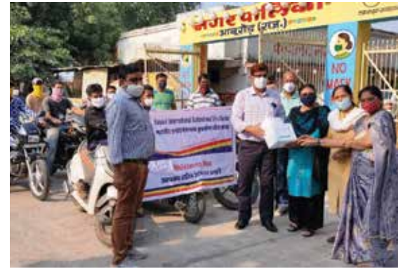
मास्क वितरण सेवाकार्य

जालौर-सिरोही संभाग स्थित महावीर इन्टरनेशनल सुर्दशना वीरा आबूरोड़ केन्द्र द्वारा नवम्बर माह में एन-95 मास्क वितरण सेवाकार्य एवं जागरूकता रैली का आयोजन किया। पदाधिकारियों ने जागरूकता रैली के माध्यम से आमजन को जागरूक किया। तत्पश्चात् नगरपालिका में स्वच्छताकर्मी एवं कर्मचारियों को मास्क वितरित किए।