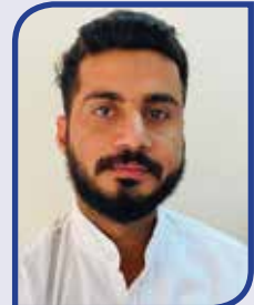
केंद्र सचिव वीर चंद्रप्रकाश डेलू