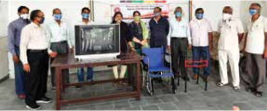
दिव्यांग विद्यालय में सामग्री भेंट

अजमेर संभाग स्थित महावीर इन्टरनेशनल अजमेर केन्द्र द्वारा अक्टूबर माह में नो मास्क-नो एंट्री एवं नो मास्क नो सर्विस जागरूकता अभियान आयोजित किया। इस माह