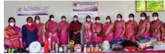
खुशियों का बाजार सेवाकार्य

संक्रमणकाल के दौरान निरंतर सेवारत सुरक्षा योद्धाओं ने प्रत्येक स्तर पर अपनी सेवाएं प्रदान की है। इसी क्रम में नो मास्क नो एंट्री अभियान के अंतर्गत वीरा पदाधिकारियों द्वारा कोरोना योद्धाओं, नगरपालिका में स्वच्छताकर्मों, पुलिस कर्मचारियों को 300 एन-95 मास्क वितरित किए गए। कोविड केयर सेंटर एवं नगरपालिका में स्वच्छताकर्मों को 200 एन-95 मास्क वितरित किए गए। पुलिस कर्मचारियों एवं सुरक्षा योद्धाओं को 100 एन-95 मास्क वितरित किए गए।