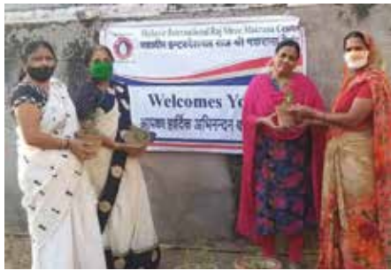
औषधीय पौधावितरण कार्यक्रम

अजमेर संभाग स्थित महावीर इंटरनेशनल राजश्री मकराना वीरा केन्द्र द्वारा अक्टूबर माह में पौधारोपण कार्यक्रम के तहत तुलसी पौधा वितरण कार्यक्रम आयोजित किया गया। कार्यक्रम में वीरा पदाधिकारियों ने स्थानीय लोगों को तुलसी की औषधीय गुण के विषय में बताया। साथ ही कोविड से बचाव हेतु