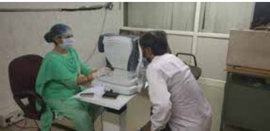
Free Multispeciality Medical camp

Mega Multispeciality Medical Camp: 2112 persons were examined in various camps free of cost and proper counseling was given.