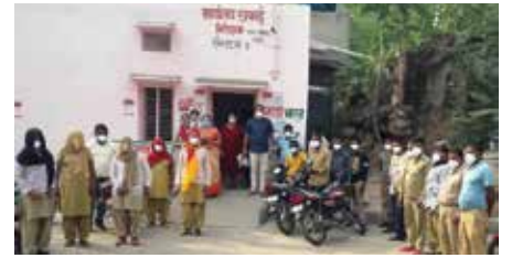
Distribution of food items

MI Prayas Vira Center Alwar : In October month distributed monthly ration Kit to 15 needy families at Jain Dada wari Alwar. In November