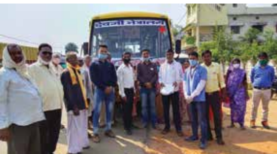
मास्क वितरण सेवाकार्य

महाकौशल संभाग स्थित महावीर इन्टरनेशनल लांजी केन्द्र द्वारा अक्टूबर माह में निःशुल्क स्वास्थ्य जाँच, मोतियाबिंद ऑपरेशन शिविर आयोजित किया गया। शिविर में 30 मरीजों की जाँच की गई। 14 मरीजों के मोतियाबिंद ऑपरेशन कराए गए। 11 मरीजों की सामान्य जाँच कर निःशुल्क दवाई उपलब्ध कराई।