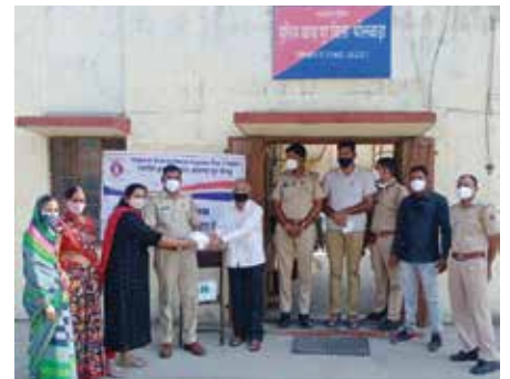
मास्क वितरण सेवाकार्य

भीलवाड़ा संभाग स्थित महावीर इन्टरनेशनल आंजना पुर वीरा केन्द्र एवं महावीर इन्टरनेशनल पुर केन्द्र द्वारा नवम्बर माह