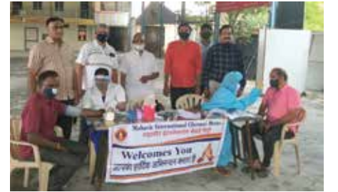
निःशुल्क नेत्र परीक्षण, मोतियाबिंद ऑपरेशन शिविर

ऑपरेशन शिविर आयोजित किया गया। शिविर में अग्रवाल आई हॉस्पिटल की टीम ने 51 मरीजों की नेत्र जांच की। 10 मरीजों को मोतियाबिंद ऑपरेशन हेतु चयनित किया गया। नजर दोष पाए जाने वाले 15 मरीजों को चश्में प्रदान किए। शिविर स्थल पर 49 मरीजों की बीपी व शुगर जांच की गई। केन्द्र की ओर से कोविड 19 के तहत सोशल डिस्टेंस एवं सुरक्षा व्यवस्था की पालना की गई।