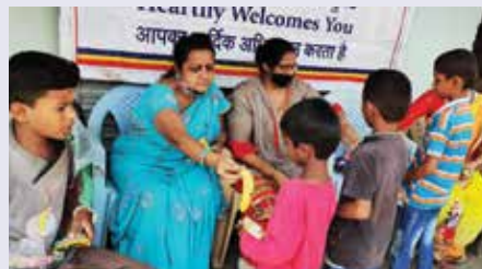
जागरूकता शिविर में बच्चों को अल्पाहार वितरण

कर्नाटक संभाग स्थित महावीर इन्टरनेशनल रायचूर वीरा केन्द्र द्वारा नवम्बर माह में विद्यालय बच्चों के साथ समय व्यतीत किया। वीराओं ने बच्चों को कोरोना बचाव- सोशल डिस्टेंस, हाथों को समय-समय पर स्वच्छ रखना, मास्क पहनना, घर पर ही समय का सुदपयोग किस प्रकार करें स्वास्थ्य संबंधी