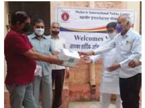
मास्क वितरण सेवाकार्य

बीकानेर संभाग स्थित महावीर इंटरनेशनल नोखा केन्द्र द्वारा अक्टूबर माह में राजकीय नर्सिंग प्रशिक्षण केन्द्र पर मास्क वितरण