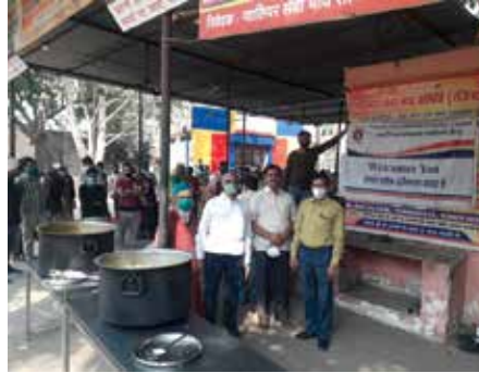
सस्नेह भोजन सेवाकार्य

भोपाल संभाग स्थित महावीर इंटरनेशनल ग्वालियर केन्द्र द्वारा अक्टूबर माह में