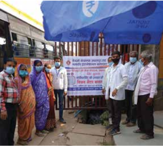
निःशुल्क नेत्र जाँच, मोतियाबिंद शिविर संपन्न

परिवहन की व्यवस्था की गई। साथ ही मास्क एवं 300 सेनेटाइजर किट वितरित किए गए। एन-95 मास्क वितरण सेवाकार्य: मास्क ही वैक्सीन है, संदेश के साथ मास्क वितरण सेवाकार्य का शुभारम्भ मुख्य अतिथि स्थानीय कलेक्टर ने किया। कार्यक्रम में नगरपालिका कर्मचारी एवं स्वास्थ्यकर्मियों, पुलिस प्रशासन एवं जिला प्रशासन को 1000 मास्क वितरित किए गए।