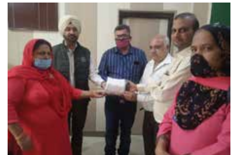
मास्क वितरण सेवाकार्य

नॉर्थ संभाग-2 स्थित महावीर इन्टरनेशनल मालेरकोटला केन्द्र द्वारा नवम्बर माह में दिव्यांग चिन्हिकरण, उपकरण वितरण शिविर आयोजित किया गया। शिविर में दिव्यांग व्यक्तियों को ट्राइसाइकिल भेंट की। एन-95 मास्क वितरण: सिविल हॉस्पिटल में आशा कार्यकर्ता को 61 मास्क वितरित किए गए।