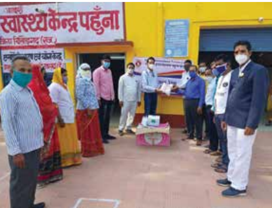
मास्क वितरण सेवाकार्य आयोजित

चित्तौड़गढ़ संभाग स्थित महावीर इन्टरनेशनल पहुंचना केन्द्र द्वारा अक्टूबर माह में राजकीय आदर्श प्राथमिक स्वास्थ्य केन्द्र में मास्क ही