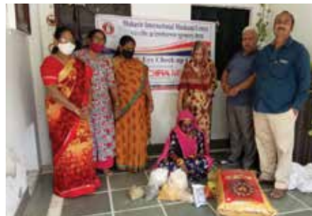
राशन सामग्री किट वितरण

भीलवाड़ा संभाग स्थित महावीर इन्टरनेशनल मुस्कान केन्द्र द्वारा नवम्बर माह में राशन सामग्री किट वितरण सेवाकार्य आयोजित किया गया। कार्यक्रम में जरूरतमंद 1 परिवार को राशन सामग्री (गेहूँ 50 किलो, शक्कर 5 किलो, 1 किलो दालें, 2 किलो चने की दाल, चाय 1 किलो, चावल 5 किलो, घी 1 किलो, तेल 1 किलो, गुड़ 2 किलो, मसाले एवं खाद्य सामग्री) किट वितरित किए। एन-95 मास्क वितरण: स्थानीय स्वास्थ्य केन्द्र पर आशा कार्यकर्ता एवं स्टाफ को 100 एन-95 मास्क वितरित किए गए।