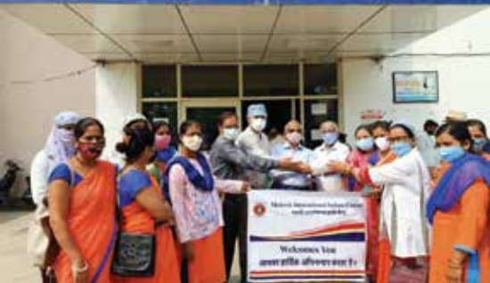
मास्क वितरण सेवाकार्य

हॉस्पिटल में आयोजित किया गया। कार्यक्रम में आशा कार्यकर्ताओं, चिकित्सक टीम, नर्सिंग स्टाफ एवं कर्माचारियों, स्वच्छताकर्मियों को 500 एन-95 मास्क वितरित किए गए।