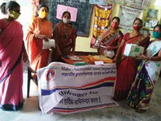
मास्क वितरण सेवाकार्य

भीलवाड़ा संभाग स्थित महावीर इंटरनेशनल आनंद सांगानेर वीरा केन्द्र द्वारा नवम्बर