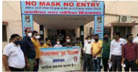
मास्क वितरण सेवाकार्य

अजमेर संभाग स्थित महावीर इन्टरनेशनल युवा बिजयनगर केन्द्र द्वारा अक्टूबर माह में एन-95 मास्क वितरित किए गए। नगरपालिका