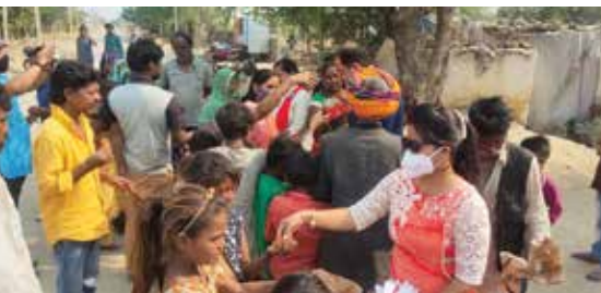
बाल दिवस सेवाकार्य

भीलवाड़ा संभाग स्थित महावीर इंटरनेशनल हैप्पीनेस केन्द्र द्वारा नवम्बर माह में बाल दिवस एवं दीपावली पर्व कावाखेडा में बच्चों के साथ मनाया। कार्यक्रम में वीराओं ने सभी बच्चों को मिठाईयां बांटी। साथ ही वीराओं ने बाल दिवस के महत्व से बच्चों को अवगत कराया। साथ ही कोरोना बचाव संबंधी जानकारी देकर बच्चों को जागरूक किया।