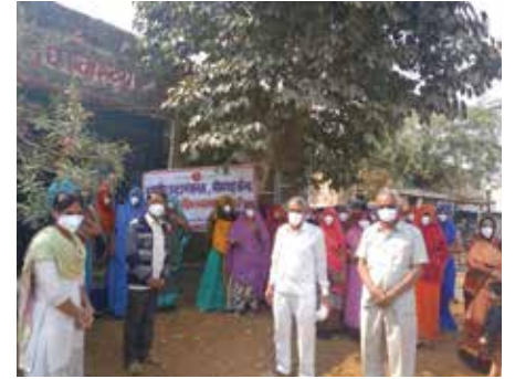
मास्क वितरण सेवाकार्य

चित्तौड़गढ़ संभाग स्थित महावीर इन्टरनेशनल भीमगढ़ केन्द्र द्वारा नवम्बर माह में एन-95 मास्क वितरण सेवाकार्य आयोजित किया गया। कार्यक्रम में उपस्वास्थ्य केन्द्र पर स्वास्थ्यकर्मी एवं स्वच्छताकर्मियों को 100 एन-95 मास्क वितरित किए गए।