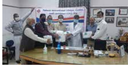
मास्क वितरण सेवाकार्य

उदयपुर संभाग स्थित महावीर इंटरनेशनल उदयपुर केन्द्र द्वारा सितम्बर-अक्टूबर माह में महाराणा भूपाल राजकीय चिकित्सालय के बाल विभाग में 79 केएमसी बेग, 36 प्लास्टिक टब, 36 स्टील बर्तन, 40 टॉवल, 40 गाऊन, 200 बिस्किट पैकेट, 100 सतू पैकेट सुपुर्द किए। आयुर्वेदिक काढ़ा शिविर: केन्द्र एवं कंचन सेवा संस्थान के तत्वावधान में रोग-प्रतिरोधक क्षमता की सदभावना से 3050 व्यक्तियों को आयुर्वेदिक काढ़े का सेवन कराया। सस्नेह भोजन सेवाकार्य: विभिन्न स्थानों पर 530 व्यक्तियों को स्नेहपूर्वक भोजन कराया। मदरमिल्क बैंक सेवाकार्य: दिव्य मदरमिल्क बैंक में 827 मातृशक्ति को नारियल