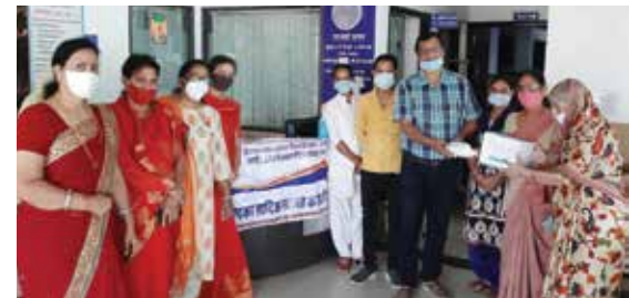
मास्क वितरण सेवाकार्य आयोजित

भीलवाड़ा संभाग स्थित महावीर इंटरनेशनल मीरां भीलवाड़ा केन्द्र द्वारा अक्टूबर माह में जीवदया सेवाकार्य के तहत 2 गौशालाओं में