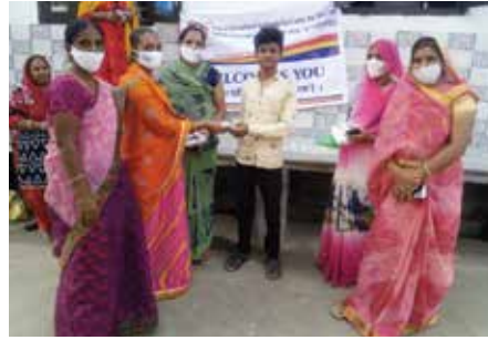
मास्क वितरण सेवाकार्य

भीलवाड़ा संभाग स्थित महावीर इन्टरनेशनल संघर्ष वीरा पुर केन्द्र द्वारा अक्टूबर माह में नो मास्क नो एंट्री अभियान के तहत मास्क वितरण कार्यक्रम आयोजित किया गया।