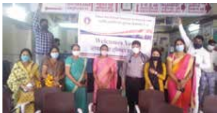
हॉस्पिटल में कुर्सियां भेंट

अजमेर संभाग स्थित महावीर इंटरनेशनल सुमंगला किशनगढ़ वीरा केन्द्र द्वारा अक्टूबर माह में वाईएन हॉस्पिटल में 50 कुर्सियां भेंट की गईं।