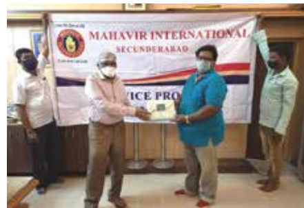
Distribution of mask

तेलंगाना संभाग स्थित महावीर इंटरनेशनल उडान केन्द्र द्वारा नवम्बर माह में एन-95 मास्क वितरण सेवाकार्य अर्बन डेवलपमेंट अथॉरिटी में आयोजित किया गया। कार्यक्रम में कर्मचारियों को सोशल डिस्टेंस एवं मास्क पहनने के प्रति जागरूक किया। पदाधिकारियों ने सभी कर्मचारियों एवं सुरक्षा योद्धाओं को 400 एन-95 मास्क एवं फूड पैकेट वितरित किए।