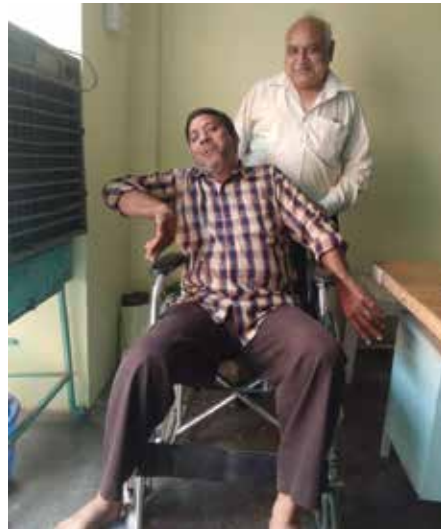
दिव्यांग को व्हीलचेयर भेंट