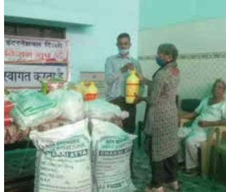
Ration Distribution at old age home

Distribututed 20 Ration bags to poor and needy at Hauz Rani, Badarpur and Nabi Karim. Distributed notebooks and stationary items to 244 boys