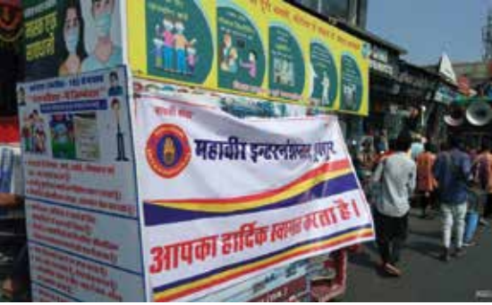
कोरोना बचाव जागरूकता रैली

इन्टरनेशनल डूंगरपुर-प्रियदर्शना केन्द्र के तत्वावधान में अक्टूबर माह में नगरपरिषद के साथ मिलकर कोरोना बचाव जागरूकता वाहन रैली आयोजित की गई। कार्यक्रम में वीर-वीरा एवं हिलसिटी केन्द्र पदाधि कारियों ने विभिन्न स्थानों से वाहन रैली के माध्यम से लोगों को कोरोना बचाव के प्रति जागरूक किया। साथ ही जरूरतमंद व्यक्तियों को 1000 मास्क वितरित किए गए। नवम्बर माह: केन्द्र द्वारा संचालित वाटर हार्वेस्टिंग परियोजना का श्री सत्येन्द्र जैन मंत्री दिल्ली सरकार ने अवलोकन किया। इस अवसर पर केन्द्र पदाधिकारियों ने मंत्री जी का स्वागत किया। तत्पश्चात् केन्द्र अध्यक्ष ने महावीर इन्टरनेशनल एवं केन्द्रों द्वारा संचालित की जा रही परियोजनाओं से अवगत कराया।