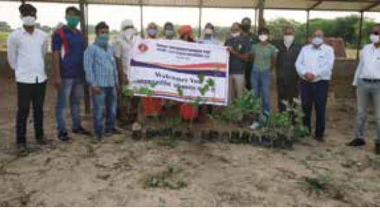
पौधारोपण कार्यक्रम आयोजित

गौशाला में पौधारोपण कार्यक्रम आयोजित किया गया। कार्यक्रम में पौधे रोपित किए गए। गौशाला परिसर को स्वच्छ किया। पक्षियों के सहायतार्थ 1000 रु दाना-पानी हेतु भेंट किया।