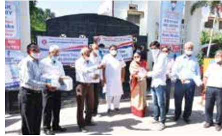
मास्क वितरण सेवाकार्य

चित्तौड़गढ़ संभाग स्थित महावीर इन्टरनेशनल चित्तौड़गढ़ केन्द्र एवं महावीर इन्टरनेशनल देशना वीरा केन्द्र के तत्वावधान में दो गज