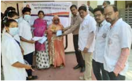
कोविड बचाव जागरूकता पम्पलेट वितरित

राजसमंद संभाग स्थित महावीर इंटरनेशनल राजसमंद केन्द्र द्वारा अक्टूबर माह में पौधारोपण कार्यक्रम फार्म हाउस में आयोजित किया गया। कार्यक्रम में 30 पौधे रोपित किए गए। कोरोना बचाव जागरूकता अभियान: नगरपरिषद के वार्डों में कोरोना बचाव जनजागृति अभियान आयोजित किया, जिनमें