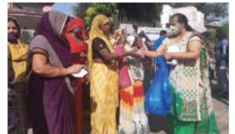
मास्क वितरण सेवाकार्य

जयपुर संभाग स्थित महावीर इन्टरनेशनल वसुधा वीरा केन्द्र द्वारा नवम्बर माह में एन-95 मास्क वितरण सेवाकार्य आयोजित किया गया। स्थानीय वार्ड में स्वच्छता कर्मचारी को 150 मास्क वितरित किए गए। वीरा पदाधिकारियों ने स्वच्छता कर्मियों को कोरोना बचाव संबंधी जानकारी प्रदान कर जागरूक किया। केन्द्र द्वारा संचालित स्वर्ण प्राशन संस्कार के पंचम शिविर में बच्चों को इम्यूनिटी बूस्टर दवा का सेवन कराया।