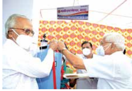
ऑक्सीजन मशीन का शुभारम्भ करते पदाधिकारी

अजमेर संभाग स्थित महावीर इन्टरनेशनल ब्यावर केन्द्र एवं महावीर इन्टरनेशनल त्रिशला वीरा ब्यावर केन्द्र द्वारा अक्टूबर-नवम्बर माह में एन-95 मास्क वितरण सेवाकार्य न्यायालय परिसर एवं रेलवे