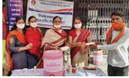
कोरोना बचाव किट वितरण

चित्तौड़गढ़ संभाग स्थित महावीर इन्टरनेशनल देशना वीरा केन्द्र द्वारा नवम्बर माह में मास्क वितरण सेवाकार्य आयोजित किया गया। नो मास्क नो एंट्री अभियान के तहत नगर परिषद के स्वच्छता कर्मचारियों को 200 मास्क वितरित किए गए। केन्द्र की ओर से 1000 मास्क का वितरण आमजन एवं राजकीय