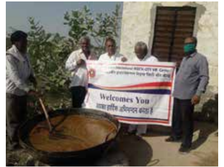
जीवदया सेवाकार्य आयोजित

जोधपुर संभाग स्थित महावीर इंटरनेशनल मेड़ता सिटी केन्द्र द्वारा अक्टूबर माह में