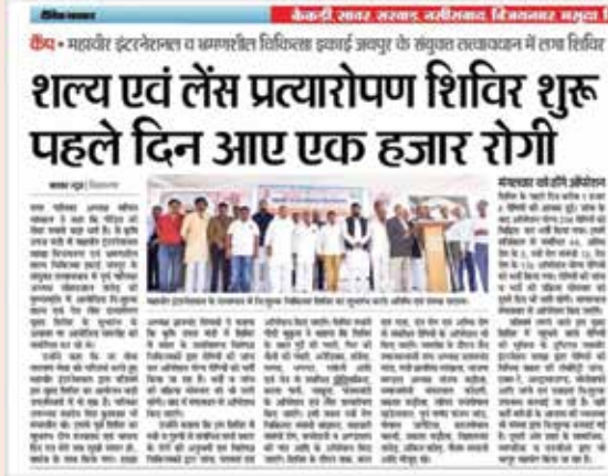
MI के साथ विशाल शल्य चिकित्सा शिविर लगाया