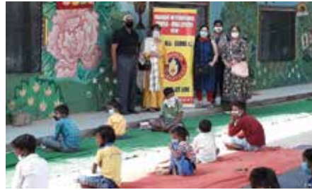
Distribution of food items

Mahavir International Urvija Vira Center Delhi In October Month celebrated the birthday of Vira Member's son at Yamuna Bridge free school. members also distributed etables items juice,