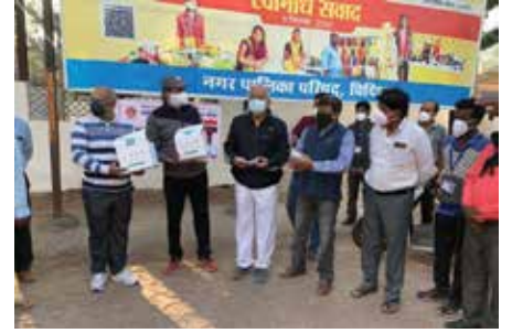
मास्क वितरण सेवाकार्य

भोपाल संभाग स्थित महावीर इंटरनेशनल विदिशा केन्द्र द्वारा नवम्बर माह में रोको टोको जागरूकता अभियान के तहत नगरपालिका कार्यालय एवं जिला अस्पताल में एन-95 मास्क वितरित किया गया। कार्यक्रम में स्वच्छताकर्मियों एवं नर्सिंग स्टाफ को 200 मास्क वितरित किए गए। साथ ही सभी को