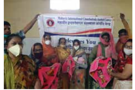
नवजात को बेबी कम्बल भेंट

भीलवाड़ा संभाग स्थित महावीर इन्टरनेशनल चन्दनबाला आसीन्द केन्द्र एवं महावीर इन्टरनेशनल सेवा संस्थान आसीन्द केन्द्र