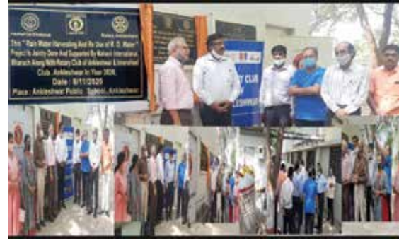
वाटर संग्रहण प्लांट लोकार्पण समारोह

गुजरात संभाग स्थित महावीर इन्टरनेशनल भरूच केन्द्र द्वारा नवम्बर माह में रोटरी