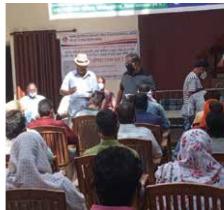
मास्क वितरण सेवाकार्य आयोजित

महाकौशल संभाग स्थित महावीर इन्टरनेशनल मलाजखंड केन्द्र द्वारा नवम्बर माह में एन-95 मास्क वितरण सेवाकार्य आयोजित किया। कार्यक्रम में नगरपालिका एवं स्वास्थ्य केन्द्र में स्वच्छता कर्मियों एवं स्वास्थ्यकर्मियों,