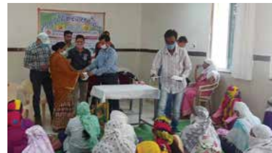
मास्क वितरण सेवाकार्य

महाकौशल संभाग स्थित महावीर इन्टरनेशनल लालबर्गा केन्द्र द्वारा नवम्बर माह में एन-95 मास्क वितरण सेवाकार्य