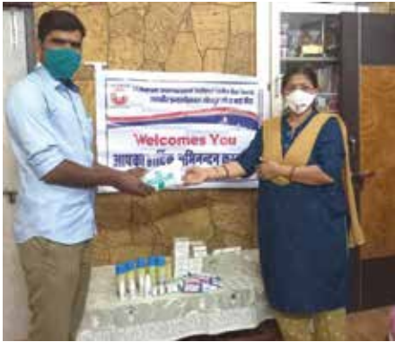
जीवदया के तहत दवाइयां भेंट

जोधपुर संभाग स्थित महावीर इन्टरनेशनल जोधाबाई वीरा केन्द्र द्वारा अक्टूबर माह में मास्क वितरण सेवाकार्य: वीराओं ने स्वच्छताकर्मी, स्वास्थ्यकर्मी, विद्यार्थियों, मेडिकल स्टाफ एवं जरूरतमंद व्यक्तियों को मास्क वितरित किए एवं मास्क ही बचाव है, संदेश देकर जागरूक किया। जरूरतमंद कन्या के विवाह में सहयोग करते हुए वस्त्र, आभूषण, उपहार, आवश्यक सामग्री एवं 15000 रु राशि भेंट कर सहयोग किया। नवम्बर माह: जीवदया सेवाकार्यों के तहत 3000 रु राशि की दवाइयां भेंट की। श्रीराम संस्कार केन्द्र में बच्चों को स्टेशनरी किट एवं मास्क वितरित किए।